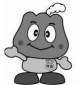
年金キャラクター「もくもく」