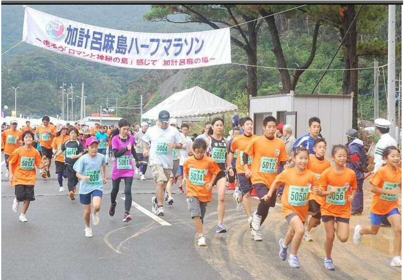
元気よくスタートするランナーたち