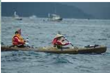
くいだおれ太郎はここにおるでえ～