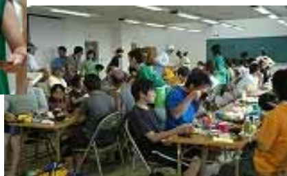
おにぎりと温かいみそ汁がおいしいで～す!!