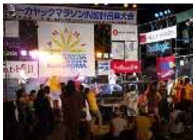
盛り上がった カサリンチュライブ