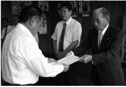
明るい社会へのメッセージを

7月の強調月間前にメッセージを伝達 6月25日、町役場で「社会を明るくする運動」のメッセージ伝達式が行われました。 法務省が主唱するこの運動は、「全ての国民が犯罪や非行の防止と、罪を犯した人々の更正について理解を深め、それぞれの立場において力を合わせ、犯罪や非行のない明るい社会を築こう」とする全国的な運動で、今年で58回目を迎えます。