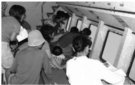
水中観光船「せと」から作品を眺める観覧者

これは、大島海峡をキャンバスにダイバーでもある作家たちが、水中に作品を展示し、自然の大切さと新たなアクトの可能性を追求する、世界でも類を見ない水中展覧会です。