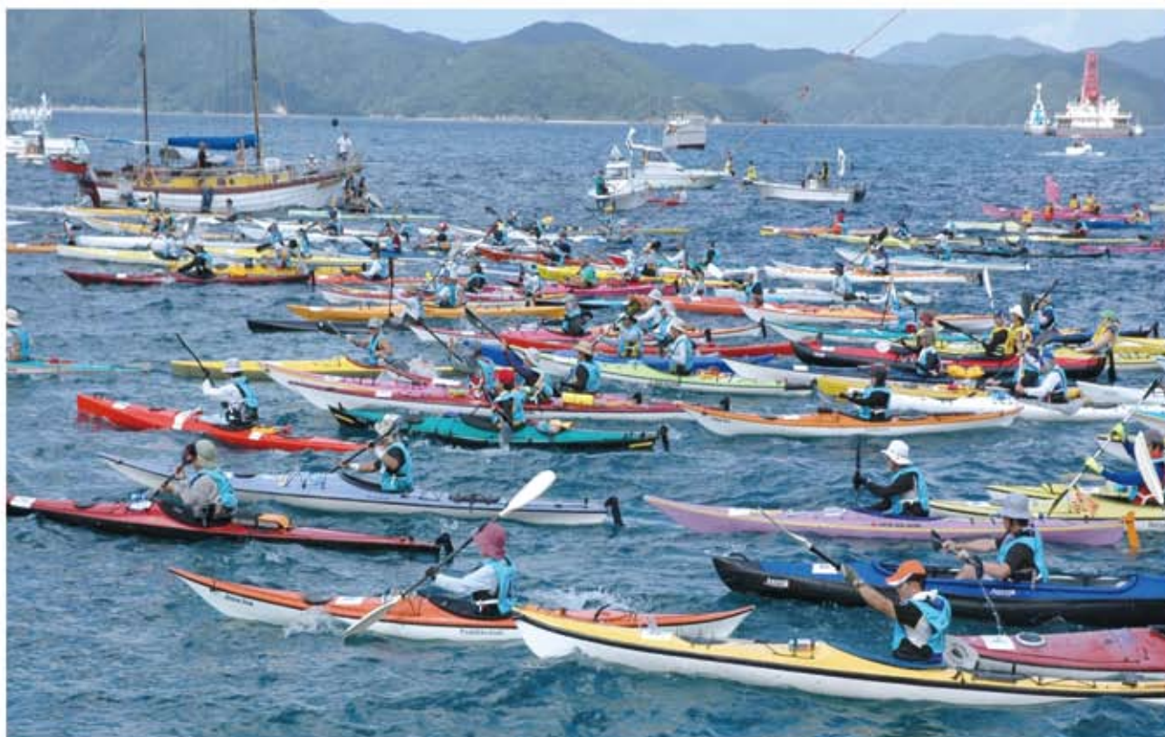
6月29日 奄美シーカヤックマラソン in 加計呂麻大会開催