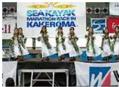
戦いに疲れた心・癒す