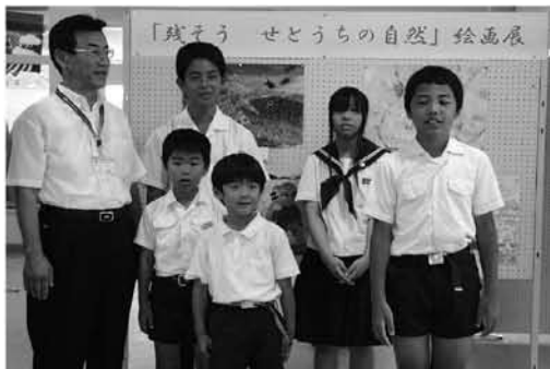
入賞者たちが一同に

なお、応募作品はアクトの開催期間中（6/28～6/30）に、せとうち「海の駅」に展示され、その後、最優秀賞など五作品は、国道沿いに設置する世界自然遺産の啓発のための看板として掲示されます。