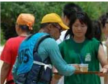
このいっぱいがウマイんだ～