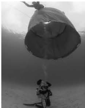
水中を漂う巨大な造形作品（作品「海の息吹」）