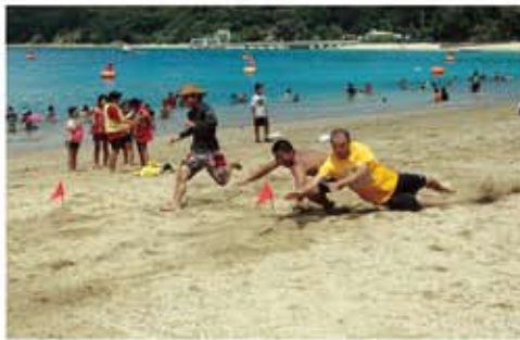
つかみ取れ！勝利を

・請・与路青年団が中心となつて運営しています。夏空のもと、海辺では海水浴を楽しむ親子やバナナボートで波しぶきを上げて海上を走る若者たちが歓声をあげていました。