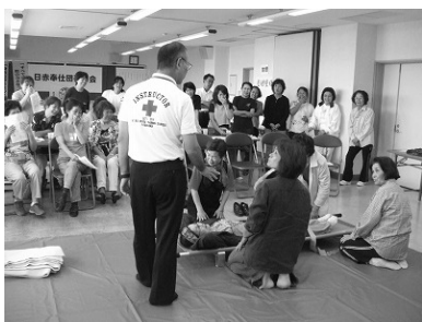
負傷者の搬送実習中

町内各地区から約50 人が参加し、今回は請島 からも参加がありました。 団員らは、講師から災 害時の被災者の止血方法 や搬送方など救急方法の 実習や非常時の炊き出し 訓練を行いました。