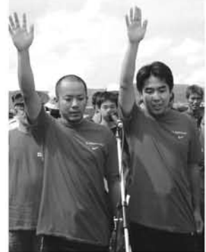
優勝目指して選手宣誓