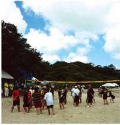
晴天の下、開催されました