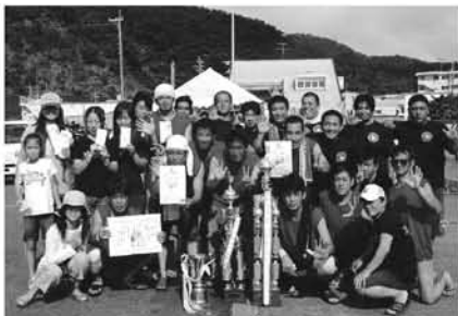
2部門(同窓・オープン)で連覇達成し 最速タイムも受賞のチキンズ44