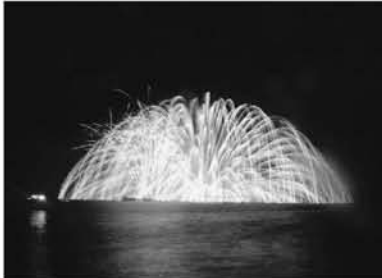
今年、県内唯一の水中花火(二尺玉)