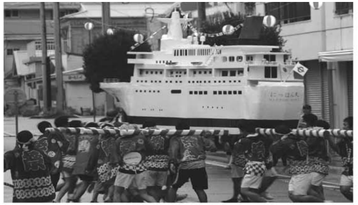
めざせ 大型客船誘致 瀬戸内感動体験クルーズを