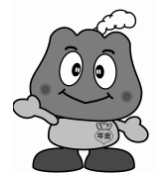
年金キャラクター 「もくもく」

「ねんきん特別便」で不明な点があれば、最寄りの社会保険事務所または「ねんきん特別便専用ダイヤル」(0570-058555)にご連絡ください。 お問い合わせ先 奄美大島社会保険事務所 0997(52)4341