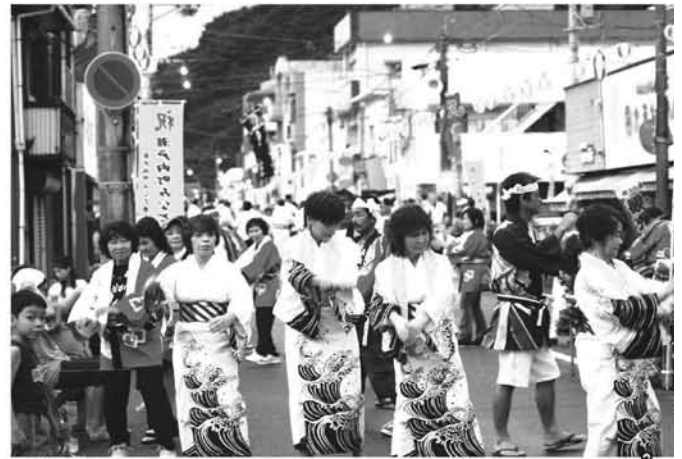
語り継ぎたい「シマ」(集落)の伝統