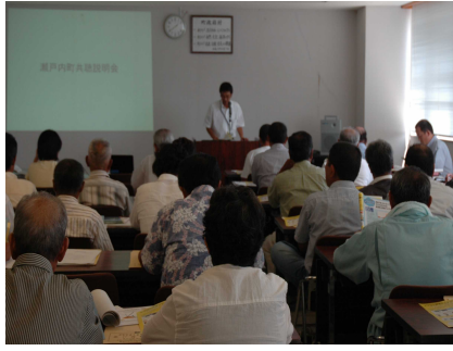
説明会 共聴アンテナについて

町長 ふるさとおこし推進事業実施要領に事業の採択基準が示してありまして、その中の1項と3項に抵触するため難しいものがあると考えております。ちなみに採択基準の1項は、国庫補助事業として、補助の採択基準上、採択されない事業を原則とするよう。