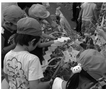
短冊を結ぶ園児達

「七夕に願いを込めて」 8月7日、旧暦の七夕 の日に、高丘保育所の園 児たちが消防署を訪問し、 願い事をいっぱい書いた 短冊をつけた竹竿を飾り 付け、七夕の唄を歌って シマの夏を楽しんでいま した。