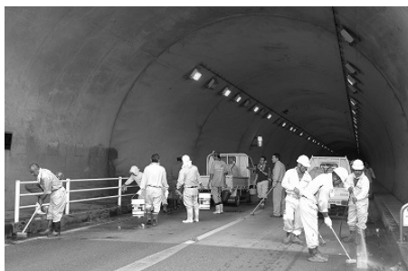
トンネルもきれいに

作業には建設業協会や 県・町の行政関係者など が参加、道路に感謝の思 いを込めて、清掃しまし た。地蔵トンネルでは交 通規制をしき放水し、道 路沿いの草木や空き缶な どのゴミを除去しました。