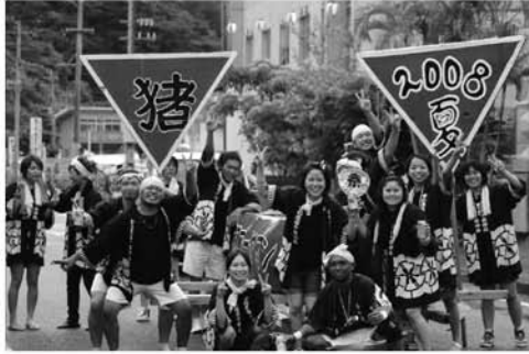
元気いっぱい古仁屋青年団