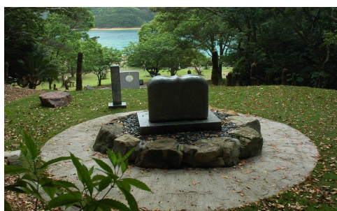
20年3月に呑之浦に建立された墓碑

残りの書物及び資料等の一括寄贈については、ご遺族の意向等も踏まえながら慎重に進めて行きたいと思っています。