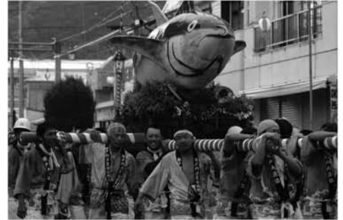
マグロが街を疾走する

8月9日と10日、第28回瀬戸内町みなと祭りが行われました。9日には相撲大会と市中パレード、歌謡・島唄・舞の夕べが、10日には海上パレードに続いて、舟こぎ競争、八月踊り、花火大会が各会場で行われ、悪天候にもかかわらず、多くの町民が参加し、賑わいを見せていました。 両日は、時折雨の降るあいにくの天気となりましたが、町内の集落や各種団体・同窓会などから、のべ三千人余りが参加し、雨をも吹き飛ばす熱気で華やかに町内を練り歩き、踊るとともに、各競技で熱戦を展開しました。 各会場には、町内各集落のほか、家族連れ、帰省客の観覧・応援する姿が見られ、2日間、町は祭り一色に包まれました。