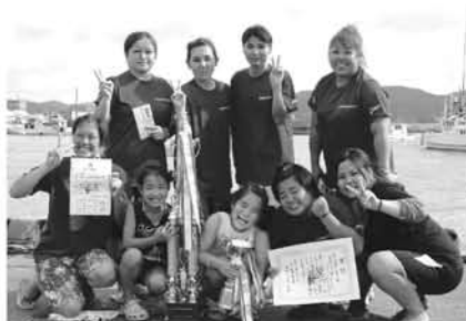
女子対抗で五連覇達成し 最速タイムも受賞のかけろまダック