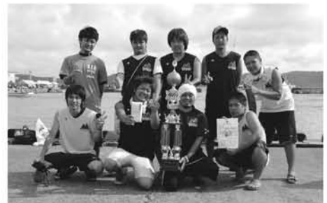
集落対抗は節子二双会A