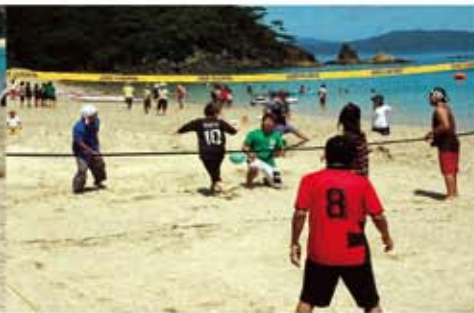
熱戦が続いたビーチバレー

浜辺では恒例のビーチバレーボール大会で熱戦が繰り広げられたほか、ビーチフラッグ大会、宝さがしゲームなども行われ、海遊び盛りだくさんのイベントとなりました。