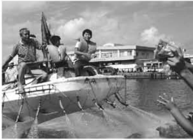
魚がふるまわれました