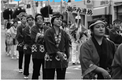
ハッピー姿もいさましく