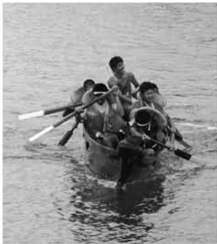
子どもたちも一生懸命