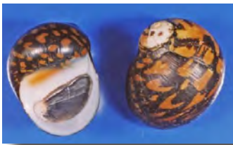
↑ムラクモカノコガイ

「鹿児島県希少野生動物植物の保護に関する条例」（平成15年12月（施行））を定めています。この条例では、希少野生動物植物の中でも特に保護を図る必要があるもの（乱獲等により、その存続に支障を来すおそれがあるもの等）を「指定希少野生動物植物」に指定し、保護を図っています。（現在39種、うち奄美関係23種） 昨年、12年ぶりに新規指定があり、奄美市と瀬戸内町に生息する「ムラクモカノコガイ」が追加されました。この貝は生息地が限られている上、環境が悪化しているため指定に至ったということです。 許可なく捕獲・採取してしまふなどの条例違反をしてしまうと、最高で1年以下の懲役又は50万円以下の罰金となっているので、ご注意ください。 今回ご紹介した「指定希少野生動物植物」（県）の一覧を、きゅら島交流館と海の駅に掲示していますので、訪れた際にはぜひご確認ください。