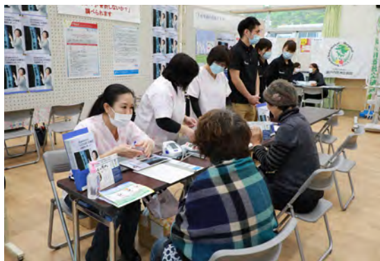
↑健康相談をする来場者