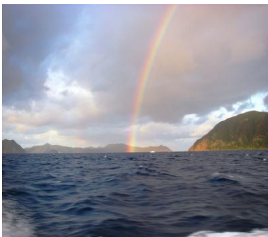
入賞作品（虹の架け橋）