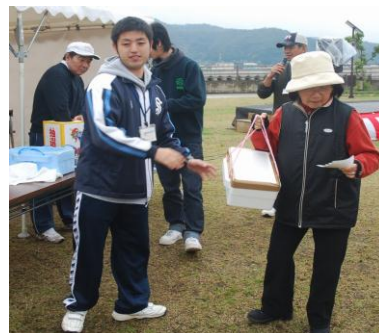
今晚の食卓には朝日ガニ