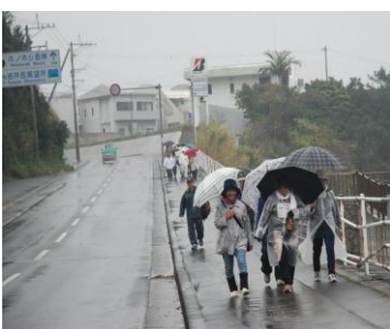
傘をさし、歩く参加者

2月13日、14日、まちづくりフェスティバルの一環として、ひぎゃ・加計呂麻ウォークが行われ、13日は、加計呂麻島を歩き、14日は、本島側の各コースを、雨の中「完歩賞」目指し、歩きました。