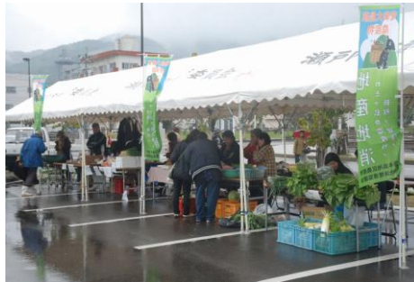
農林コーナー（新鮮野菜等）

お昼からは、ひぎや・加計呂麻ウォーク完歩者を対象に、伊勢エビや朝日ガニ、たんかん等が当たる抽選会が開かれ、抽選番号が呼ばれる度に歓声があがりました。