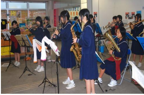
演奏中の古仁屋中学校吹奏楽部

当日は、小雨がちらつき肌寒い、あいにくの天気でしたが、オープニングに登場した古仁屋中学校吹奏楽部が、雨にも負けずひた向きに演奏する姿に、テントの中で縮こまっていた参加者も元気づけられていました。