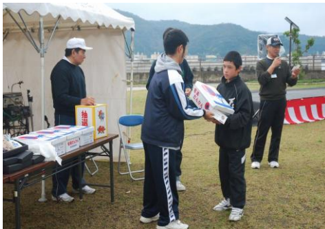
美味いたんかんが当たったよ

お昼からは、ひぎや・加計呂麻ウォーク完歩者を対象に、伊勢エビや朝日ガニ、たんかん等が当たる抽選会が開かれ、抽選番号が呼ばれる度に歓声があがりました。