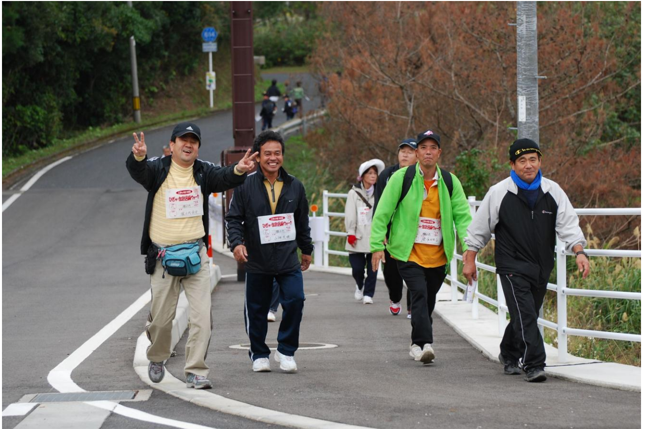
ひぎゃ・加計呂麻ウォーク 内心辛い?のに撮影には笑顔で協力