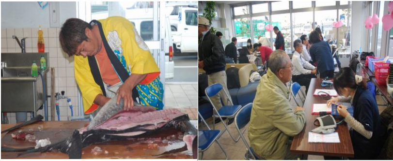
鮮魚を解体する関係者 検診を受ける参加者

「海の駅」講内では、展示コーナーや健康相談コーナーが設けられ、健康相談コーナーには、多くの人が訪れていました。漁協の運営する水産コーナーでは、物産販売のほかに鮮魚の解体ショーが行われ、人だかりができていました。