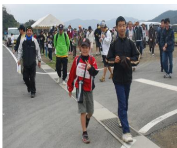
元気に出発・進行!