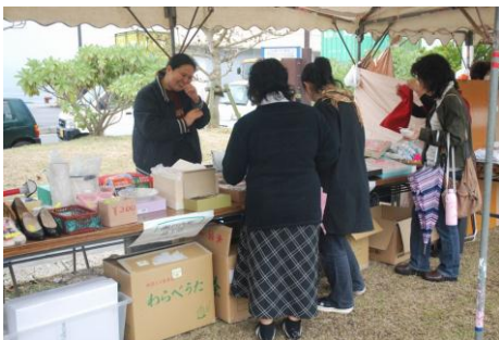
フリーマーケットコーナー

「海の駅」の周辺では、農林コーナーや地女連体験コーナー、フリーマーケット、バザーコーナーが行われ、来客者を楽しませました。