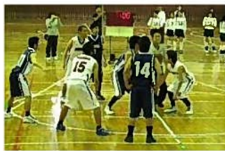
【バスケットボール】 途中で女子も参加して、中盤まで競り合いました