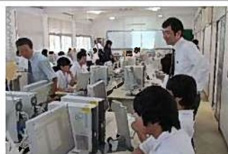
【ビジネス文書をつくろう】 商業科の教諭(坂屋園, 外山)によるパソコンの体験授業