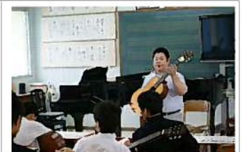
【ギターを弾こう】 槐鳥教諭ギター初体験者が多く、楽しかったとの感想でした