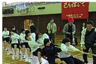
【2年女子綱引き】 一進一退の攻防の末、劇的勝利を収めました