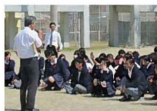
火災を想定した抜き打ちの避難訓練と校内消防組織の確認を行いました