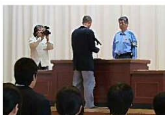
瀬戸内警察署から今年度も自転車安全利用・盗難防止モデル校に指定されました