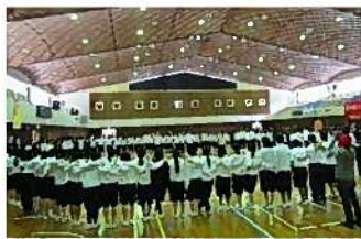
【絆を深める円陣】 綱引きの前に、全校生徒で心を一つにまとまりました