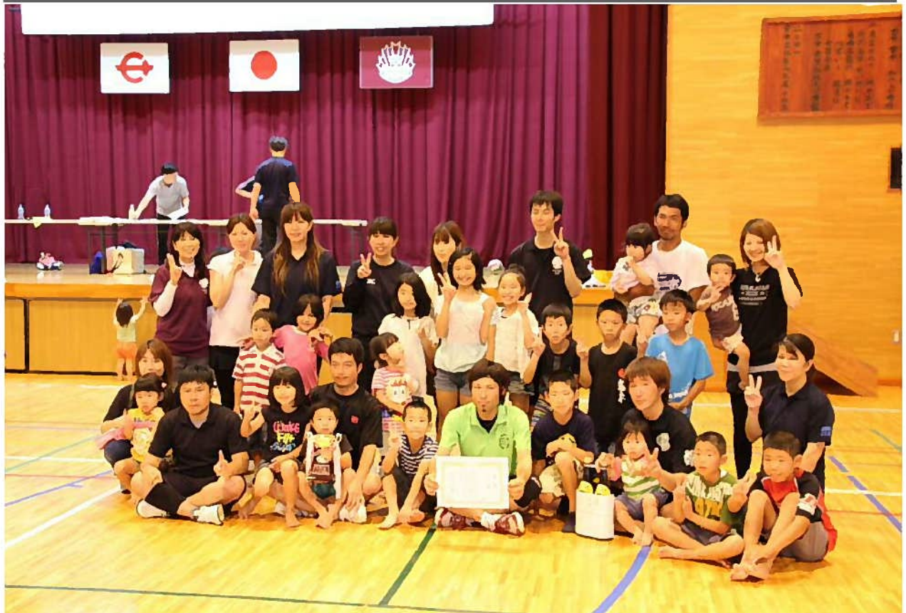
PTAバレー混合の部で優勝した古小4年生！