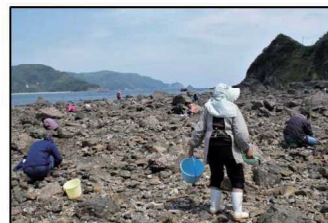
潮干狩りを楽しむ人達

また、昔からこの日に「海に行かないとカラスになる」と言われている迷信は、今でも各地区に残ってはいるようですが、近頃では、どうしても海