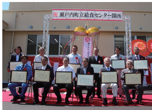
建設に携わられた皆さんへ、 感謝状が贈られました。

清水地区にて建て替えが進められていた学校給食センターが、8月30日(火)に開所式を迎えました。式には学校関係者や代表の児童生徒など約60人が出席しました。