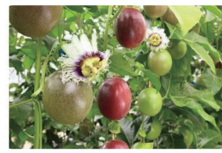
パッションフルーツ