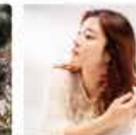
楠田 莉子(唄) kusuda riko