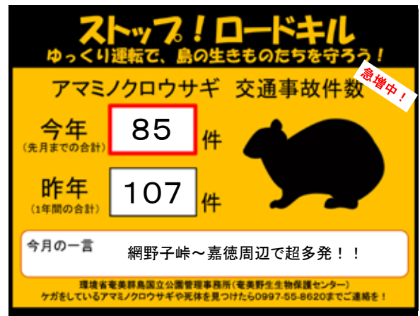
▶ アマミノクロウサギ交通事故件数