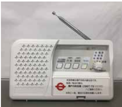
▼防災行政無線戸別受信機 (イメージ)

行政放送受信、地区別放送対応、時計表示、LEDライト、録音再生機能、壁掛・据置対応、ラジオ機能