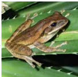
▶シロアゴガエルの成体