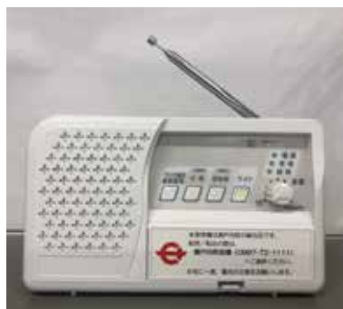
▼防災行政無線戸別受信機 (イメージ)

行政放送受信、地区別放送対応、時計表示、LEDライト、録音再生機能、壁掛・据置対応、ラジオ機能