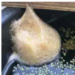
▶シロアゴガエルの泡巣

地域の自然環境や人に対して、特に被害を及ぼす恐れが高い種のことです。外来生物法により飼育、持ち運び、放流等が厳しく禁じられています。