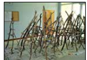
【手作りの流木イーゼル】

子どもから大人まで、これまでに知られてきた復帰にまつわる有名な話ばかりではなく、想像しがたいエピソードの数々を、選りすぐって作成した珠玉の70問となっています。問題を作った町学芸員によると、「今では考えられないようなことばかりで、かなり悩むことになるはずですよ。」と、復帰前の群島民それぞれの、復帰に賭けた熱量が伝わってきます。この機会にぜひ図書館・郷土館で、70年前の人々の情熱に思いを馳せてみてはいかがでしょうか。