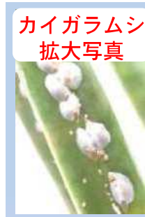
カイガラムシ 拡大写真

▶ 注意事項 葉を切り取っても、葉の付け根付近や幹などにカイガラムシが生息しているので、薬剤は念入りに散布してください。カイガラムシは風や人の衣服に付着するなどして拡がるので、被害木処理の際は衣服等に付着しないように注意してください。