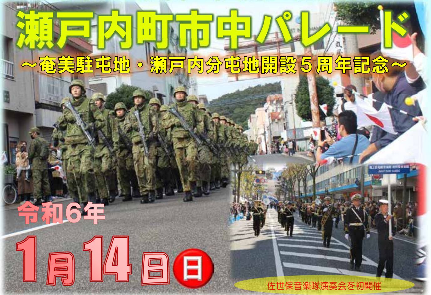
佐世保音楽隊演奏会を初開催