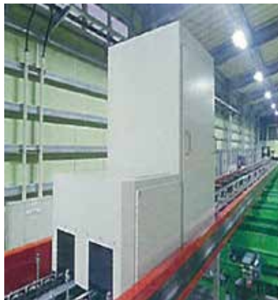
外部品質・生傷センサー