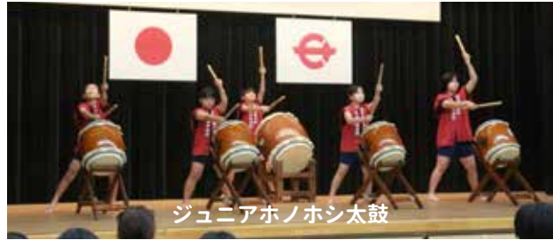
ジュニアホノホシ太鼓