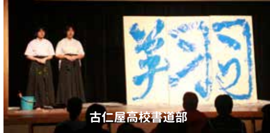
古仁屋高校書道部