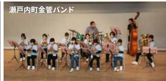
瀬戸内町金管バンド