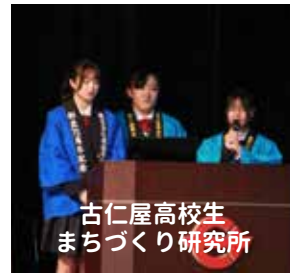
古仁屋高校生 まちづくり研究所