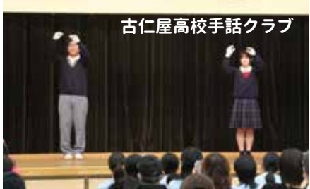
古仁屋高校手話クラブ