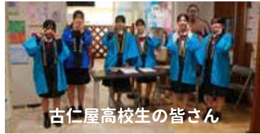
古仁屋高校生の皆さん