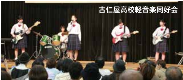
古仁屋高校軽音楽同好会