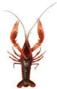
▶アメリカザリガニ