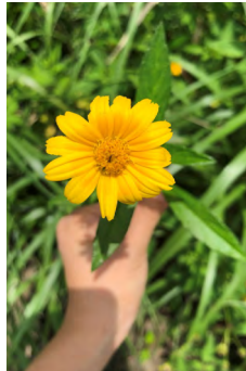
アメリカハマグルマ