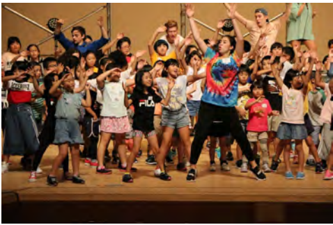
↑リハーサルの様子