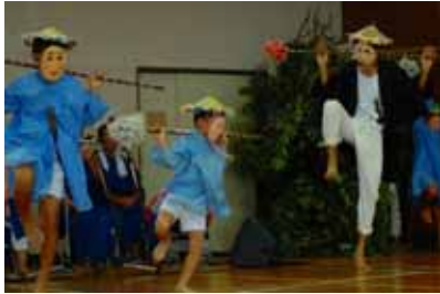
親子共演のククワ節

「ククワ節」は、明石の須磨の浦で平敦盛の墓を探してさまよう様を描き、伝承の根幹をなす重要な演目です。