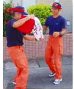
命をつなぐリレー

また、これに先立ち、大島地区消防組合瀬戸内分署では、勝浦公民館から、古仁屋市街地にかけて、AEDをバトンに、命のリレーが行われました。