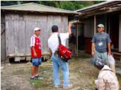
町内の空き家を見学

また、今年は町主催で移住体験ツアーを実施し、定住希望者が空き家見学やシマの産業体験や、先輩移住者や地域住民との懇談会を設けるなど、今後の定住につながるような取り組みを行っています。