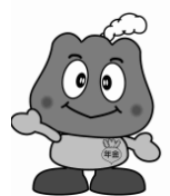
年金キャラクター 「もくもく」