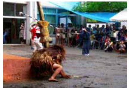
玉露カナに迫り来るシシ