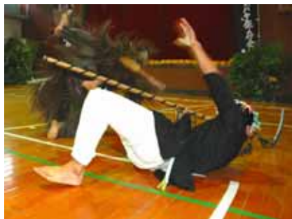
ハブニング! 狩人敗れる

諸鈍集落ではシバヤの継承に努めており、今年から人衆(にんじょう)に、諸鈍小中学校の先生も紙面をつけて踊りに参加し、親子共演を果たすなど郷土が誇る伝統芸能の舞台を盛り上げました。迫力に満ちた「シシキリ」など、躍動感あふれる演技で、体育館内は熱気に包まれていました。