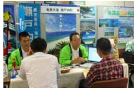
盛況だった相談ブース

また、今年は町主催で移住体験ツアーを実施し、定住希望者が空き家見学やシマの産業体験や、先輩移住者や地域住民との懇談会を設けるなど、今後の定住につながるような取り組みを行っています。