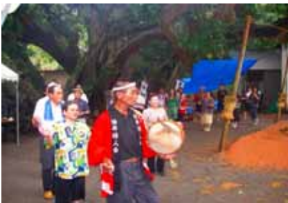
祭りの最後は八月踊り