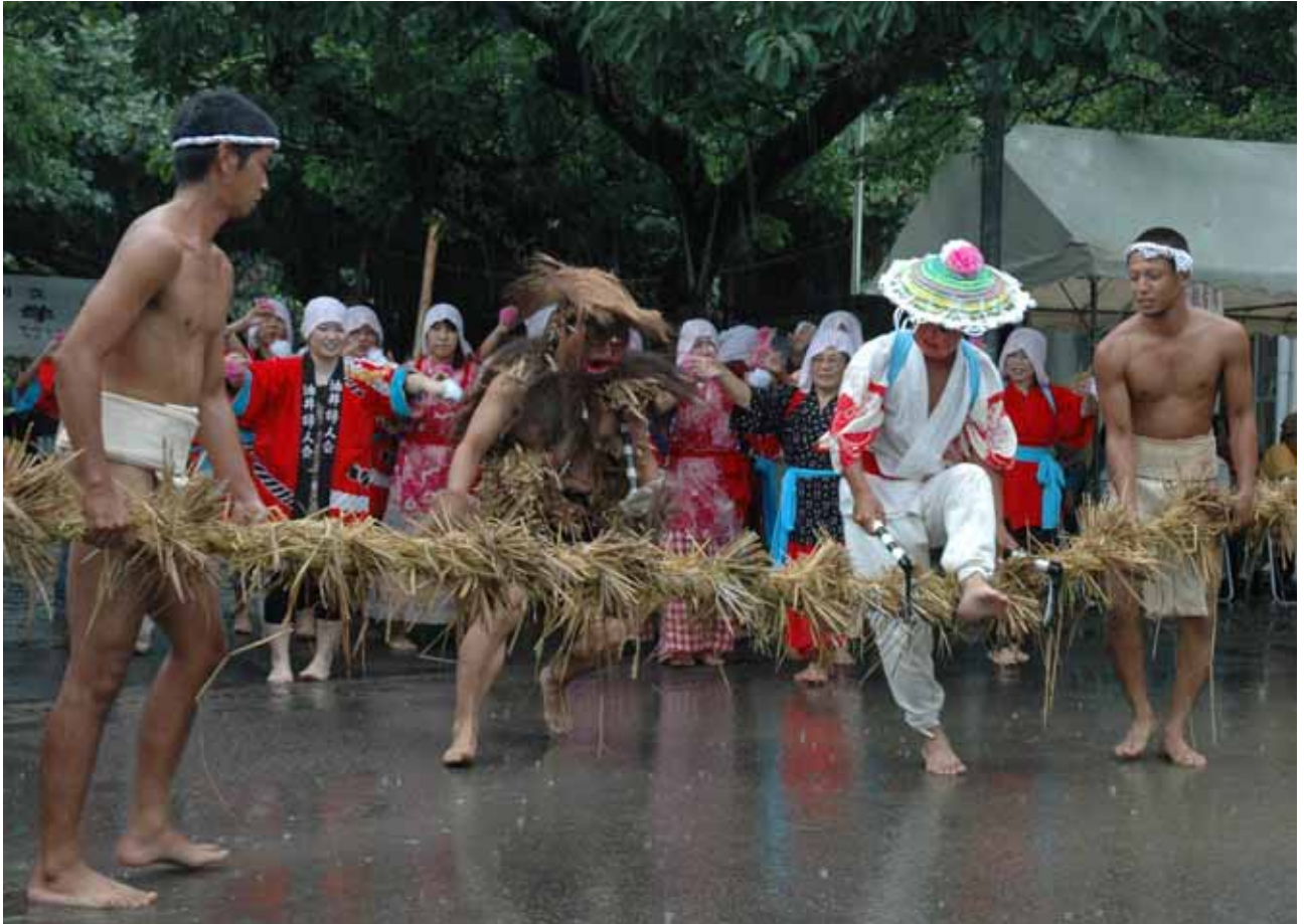
9月14日 油井の豊年踊り 「綱切り」