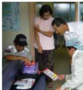
住民へ使用方法説明

大部分を占める心室細動(心臓が細かく震えるようにけいれんし、血液が体内に送り出せない状態になる)になった場合に、電気ショックにより心臓を正常に戻す救命救命機器です。2004年7月から医師や救急救命士以外に、一般市民も使えるようになりました。緊急時に正しい処置ができるよう備えておきましょう。