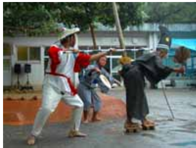
観音翁の土俵見舞い