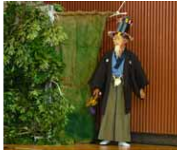
室内でのサンバトロ上

あいにくの雨のため、八百年にわたり受け継がれてきた伝統の中で、記録の残る明治以降、初めて体育館で行われました。