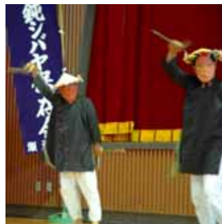
国際色豊かな演目

織り込まれていて、平家一門が交易を行っていた中国の宋の時代に御祝いに踊られたと伝えられる華やかな演目「スクテングワ」があります。