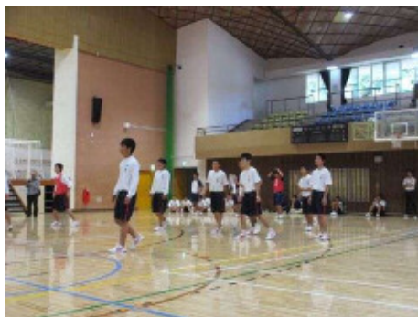
男女別ドッジボール