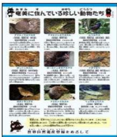
児童生徒へ配布した下敷き

この下敷きは、奄美大島自然保護協議会（奄美大島本島5市町村で構成）の協力により作成されたもので、「アマミノクロウサギ」や「オオトラツグミ」をはじめとする、国の天然記念物に指定されている動物や、絶滅危惧ⅠA類に指定されている「アマミセイシカ」をはじめ、絶滅が心配されている植物、また、人が捨てたことにより野生化し、希少な動物などを捕食していると考えられている、「ノイヌ・ノネコ」なども紹介しています。これからも、奄美の未来のために、啓発活動へのご協力よろしくお願いたします。