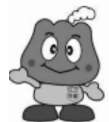
年金キャラクター「もくもく」