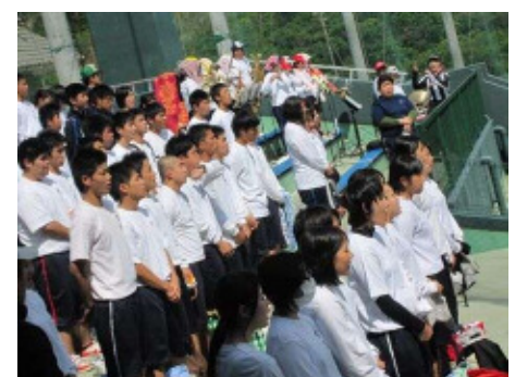
スタンドでの全校応援