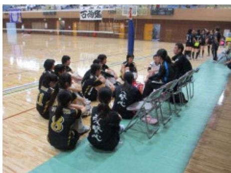
女子バレーボール