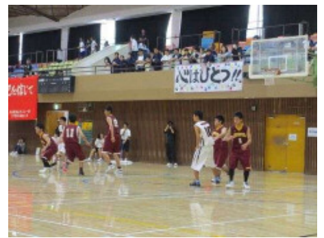
男子バスケットボール