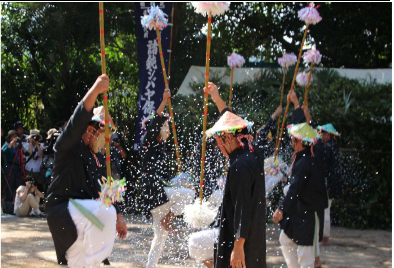
国の重要無形民俗文化財！諸鈍シバヤ