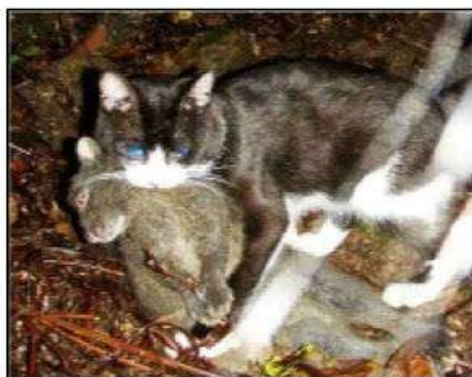
クロウサギをくわえるノネコ