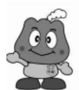
年金キャラクター「もくもく」