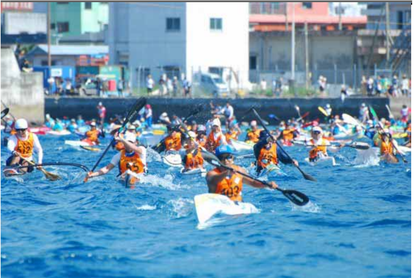
完漕目指してスタートする選手たち