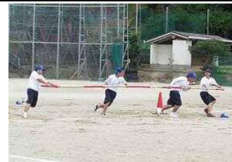
【台風の日】 外側は振り回されて遠心力が働くため足がもつれます。