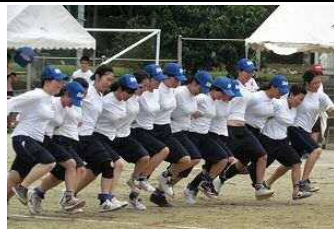
【15人16脚】 2年女子が「6秒64」の新記録を樹立しました。