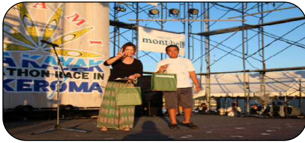
【フルマラソン (1人艇・男子)】