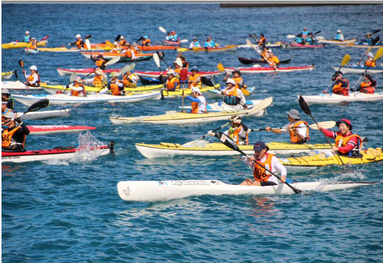
号砲の合図でスタートする選手たち！