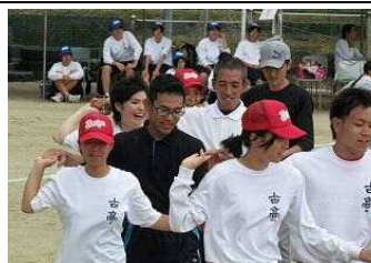
【フォークダンス】 3年生も先生方もしっかり手をつなぎ、笑顔あふれる光景でした。