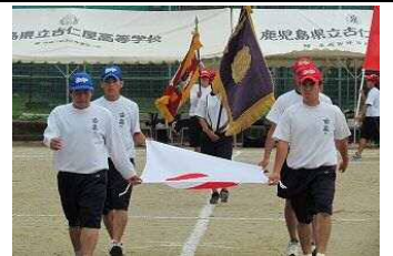
【体育祭行進】 国旗・校旗・優勝旗を持って2・3年生の堂々の行進です。