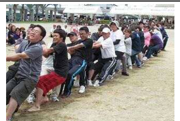
【PTA綱引き】 保護者、卒業生、職員が入り交じって、カー杯、綱を引きました。