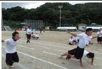
【新・古高魂】 伝統の種目復活 両足首を固定しての懸命のジャンプ!