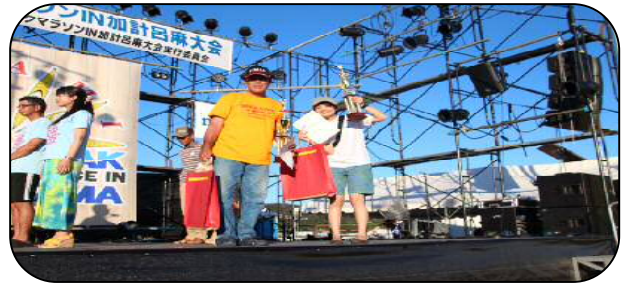
【ハーフマラソン (1人艇・男子)】