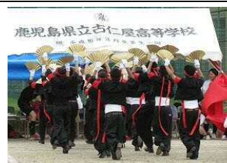
【3年応援団】 応援の部では3年生がユーモアある演技を披露し優勝しました。