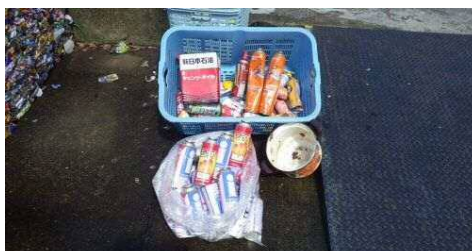
○正しく分別されなかったごみ (鍋・カセットボンベ・オイル缶)