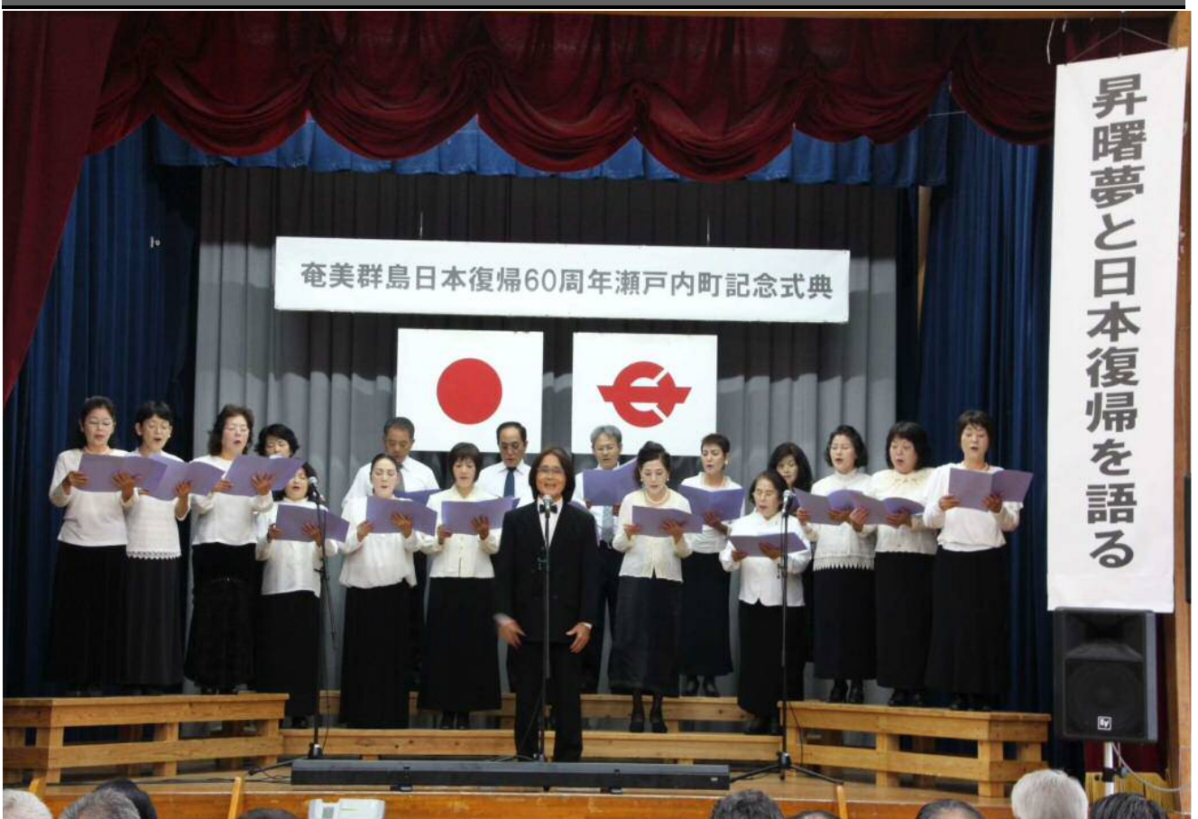
日本復帰60周年の節目を祝う！