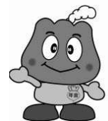
年金キャラクター 「もくもく」