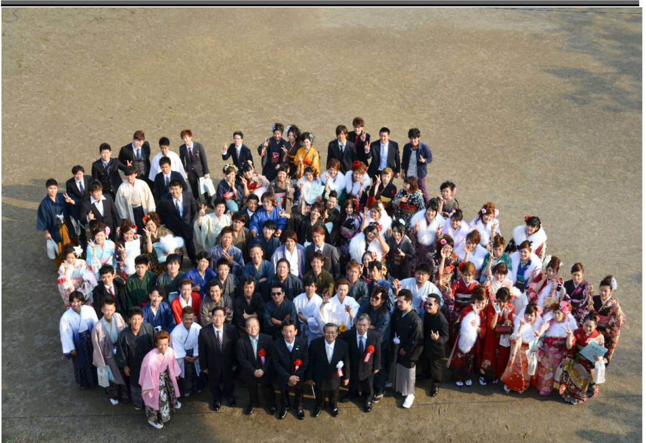
満面の笑みの新成人たち！