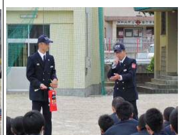
消火器の使用方の講習