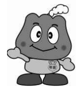
年金キャラクター 「もくもく」