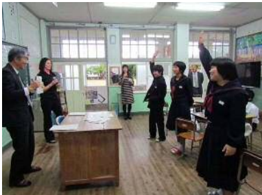
カーソンの先生と二石授業