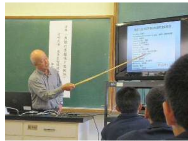
宮崎大学海洋生物環境学科「魚類の多様性と柔軟性」