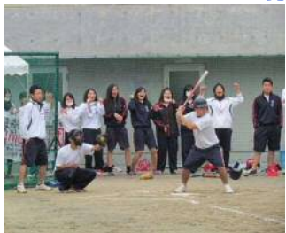
ソフトボールは3-1, パレーボールは1-1が優勝!