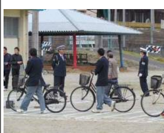
自転車実技講習を行いました