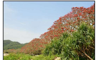
デイゴ開花の様子(昨年5月)

「那覇世」の昔、交易の目印となったデイゴの「紅い花」、これからも大切に守って行かなければなりません。