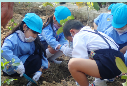
森林環境学習の様子