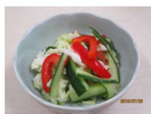
<1人分> エネルギー/ 16 kcal 食塩相当量 / 0.7 g