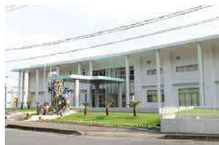
瀬戸内町きゅら島交流館 （平成30年3月完成）